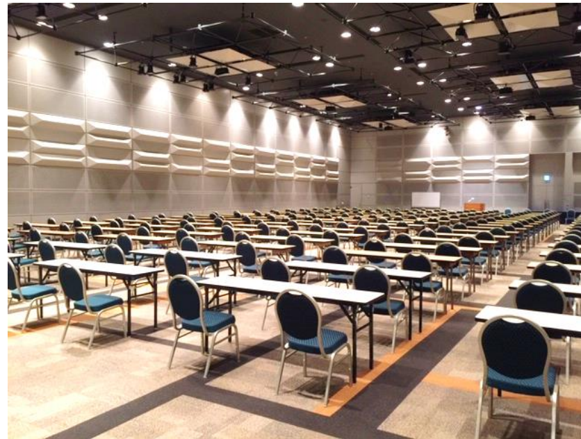
1階 イースト21ホール