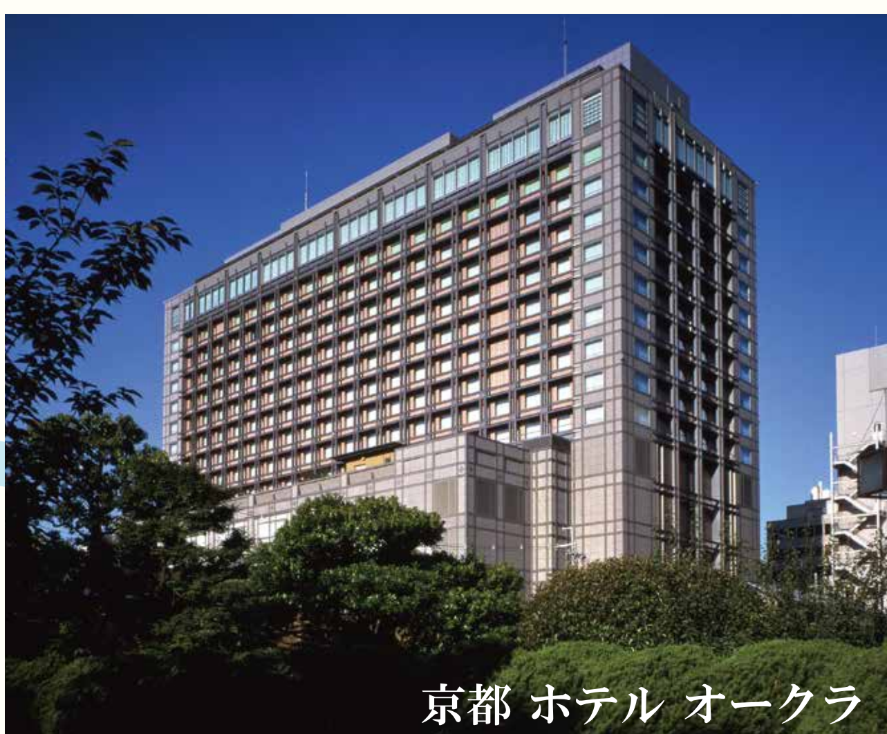
京都 ホテル オークラ