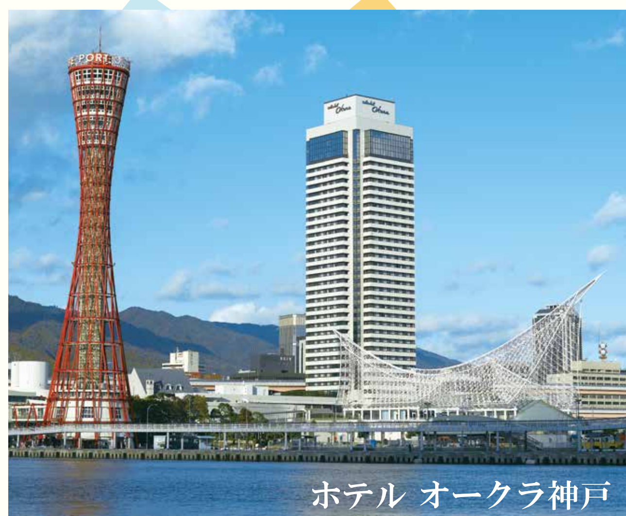
ホテル オークラ神戸

※当選賞品は発送をもって変えさせていただきます。※ご宿泊券の有効期間は、2018 年 1 月～ 6 月となります。 ※詳しくはスタッフまでご確認ください。